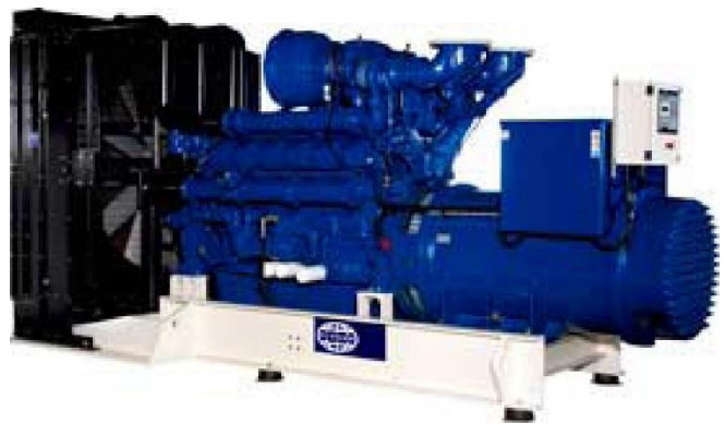
Рисунок приведен исключительно с иллюстративной целью